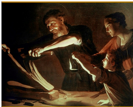
Gerard van Honthorst: A Szentcsalád az ácsműhelyben

Az embernek uralma alá kell hajtania a földet és uralkodnia kell rajta, mivel Isten képmása, személy, azaz lélekkel rendelkező alany, aki alkalmas arra, hogy előrelátóan és értelmesen cselekedjék; képes rá, hogy önálló elhatározásokat hozzon és arra törekedjék, hogy tökéletesítse önmagát. Az ember tehát mint személy a munka alanya ; mint személy dolgozik és hajtja végre a munka folyamatához tartozó különböző tevékenységeket, melyeknek - eltekintve objektív értéküktől - arra kell szolgálniuk, hogy kibontakoztassa emberi mivoltát és betöltsse hivatását, ami őt ember voltából következően mint személyt megilleti. (...) Krisztus, jóllehet Isten volt, mindenben hasonlóvá vált hozzánk, s életének nagyobbik részét a munkának szentelte és gyalupad mellett dolgozott. Ez a tény önmagában a „munka Evangéliuma”, amely nagyon világosan megmutatja, hogy az alap, amelyen a munka értékét és jelentőségét mérni kell, nem magának a munkának milyensége, hanem a személy, aki dolgozik. (...) a munka értékének elsődleges alapja maga az ember, aki alanya a munkának. (...) : jóllehet igaz, hogy az ember a munkára született és erre kapott meghívást, mégis „a munka szolgálja az embert és nem az ember a munkát”. Végelemzésben ugyanis a munka célja , bármilyen munkáé, amit az ember végez – legyen szó a legszolgáibb munkáról, vagy a közvélemény szerint legegységesebb, sőt a társadalom legalsó rétegéhez tartozó tevékenységről – mindig maga az ember marad.