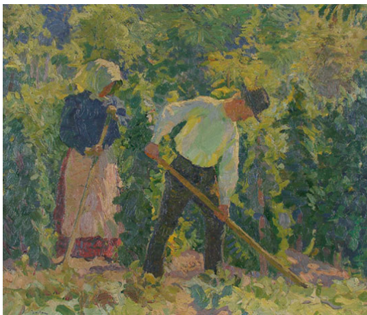
Nyilas Sándor: Földművelők