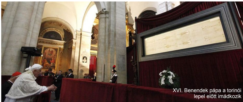
XVI. Benedek pápa a torinói lepel előtt imádkozik