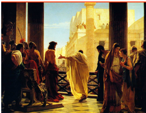
A. Ciseri: Ecce homo (1871)

(A Nagyböjti üzenet teljes szövege honlapunkon olvasható.)